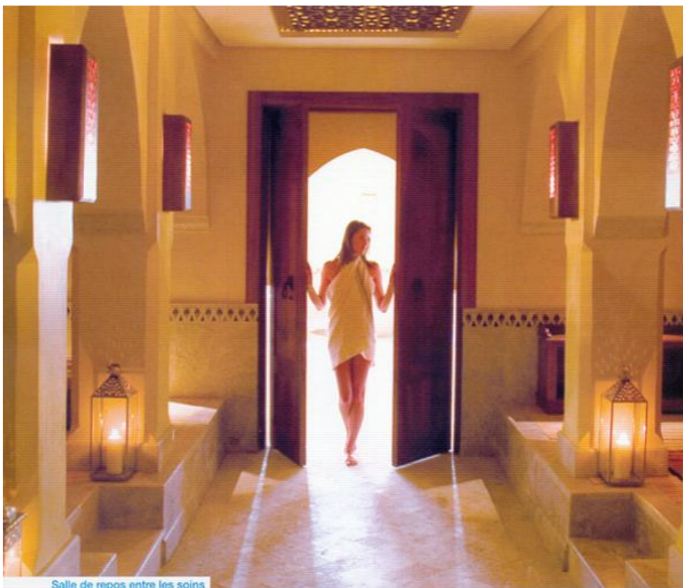
Salle de repos entre les soins