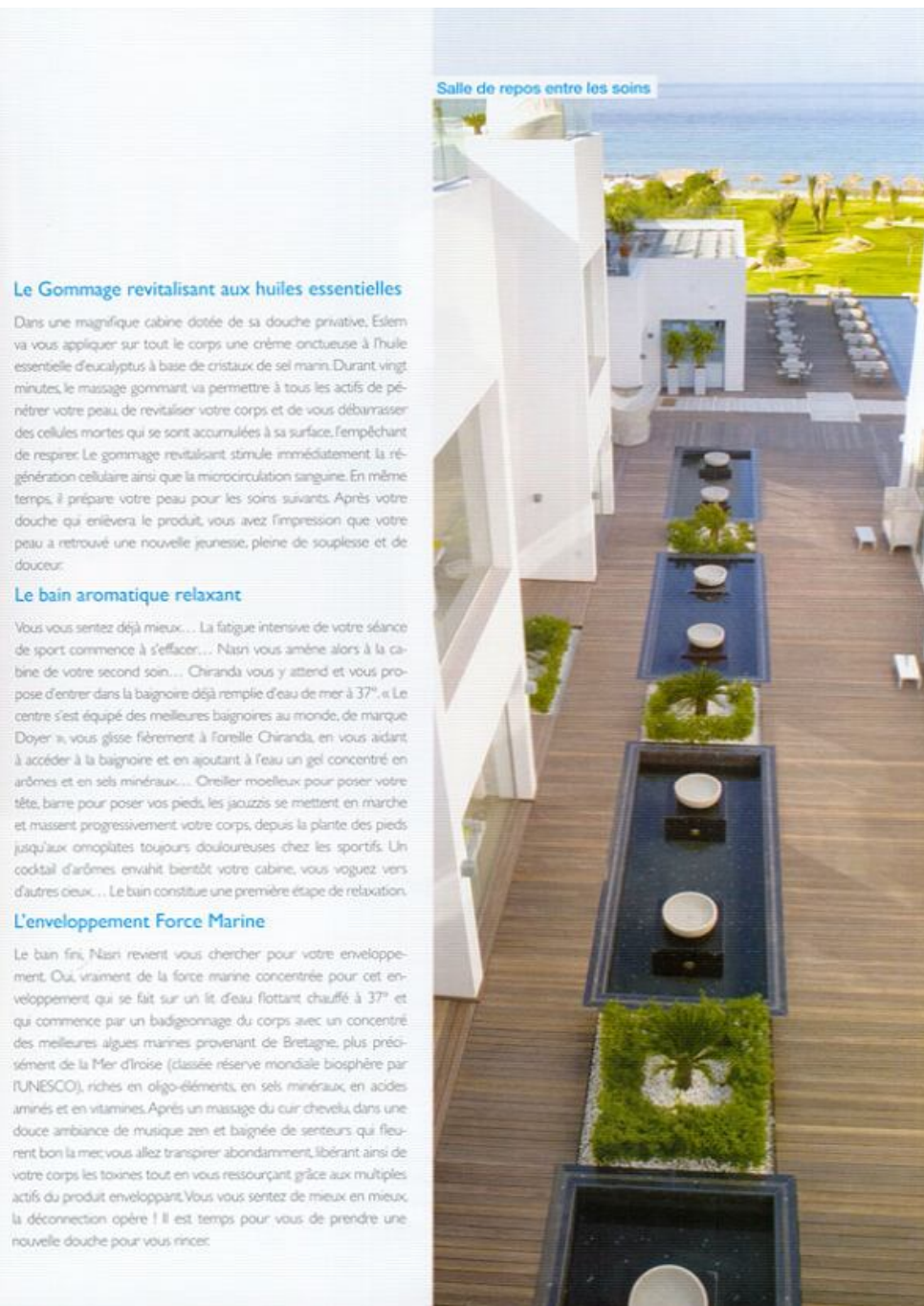
Salle de repos entre les soins